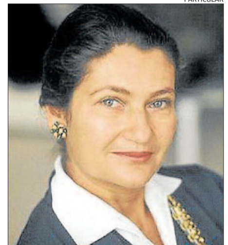
Simone Veil als anys 70

tari francès i que li va merèixer ser nomenada directora d'Administració Penitenciària. Arribat l'any 1974 era ja ministra de Sanitat del govern centrista de Valéry Giscard d'Estaing, des d'on esdevingué l'ànima de la transcendental aprovació de la llei de despenalització de l'avortament, tan ansiosament esperada per centenars de milers de dones, com també motiu d'acèrrimes crítiques ultraconservadores, fins i tot per part d'algun diputat del seu mateix grup, que qualificà Veil de «la supervivent d'Auschwitz que porta els fetus als forns crematoris». Però cal no oblidar tampoc, en la trajectòria política de Simone Veil, la seva dimensió europeista. Que li venia ja dels somnis d'aquells difícils primers anys de la postguerra quan anhelava una Europa unida on, per primera vegada a la història, la gent no hagués de patir les misèries d'un conflicte bèl·lic. Uns somnis, els seus, ja molt anteriors a aquell 1957, quan els grans líders unionistes com Adenauer, Monnet i Schuman van dissenyar l'Europa Unida. I fou ella, precisament, del 1979 al 1982, la primera dona presidenta del Parlament Europeu, on després romanagué com a diputada fins al 1993, any en què tornà a ser nomenada ministra del govern francès, aquesta vegada al departament d'Afers Socials i Sanitat. Per la mundial repercussió de les seves